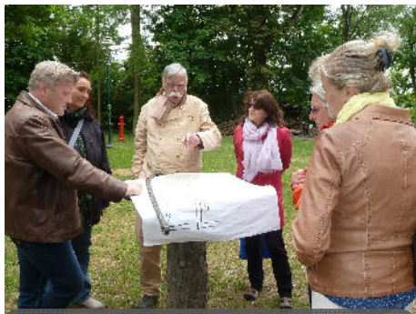
Besuch der LAG Barnim Mai 2015