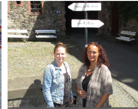
Das Team des Regionalmanagements