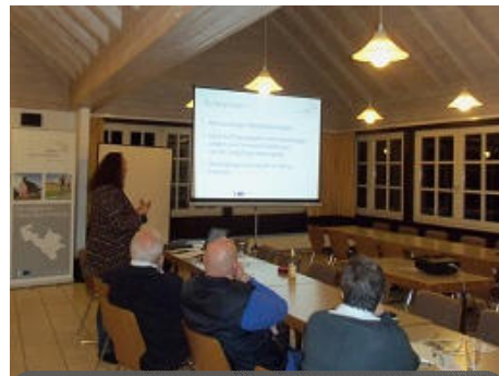
Informationsveranstaltung für Existenzgründer Nov. 2015