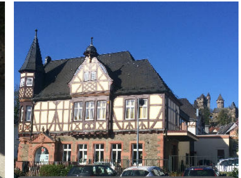
Unser Regionalbüro in Braunfels