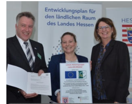
Übergabe des Anerkennungsbescheids

Die hessische Auftaktveranstaltung zum Tag der Regionen fand am 27.09.2015 im Besucherbergwerk Grube Fortuna statt. Hierzu hatten das Hessische Umweltministerium und das Regierungspräsidium Gießen gemeinsam mit der Region Lahn-Dill-Wetzlar eingeladen. Motto des Aktionstages war „Das Leben im Dorf lassen—für die Zukunft der Stadt“.