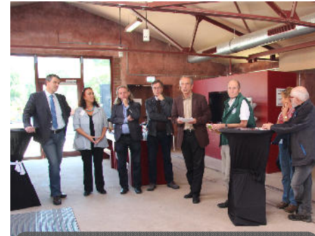
Tag der Regionen auf der Grube Fortuna Sept. 2015